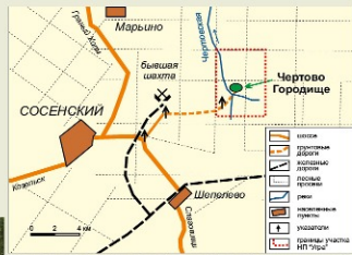
Схема проезда от г. Сосенский

Национальный парк «Угра» 248007, Россия, Калуга, Пригородное лесничество тел./факс: (4842) 277-024, 785-230 e-mail: parkugra@kaluga.ru www.parkugra.ru