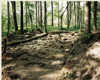
Площадка городища с археологическим раскопом

Урочище «Чертовое городище» сегодня входит в состав отдельного участка национального парка «Угра» на правом берегу р. Жидры, в окрестностях г. Сосенский.