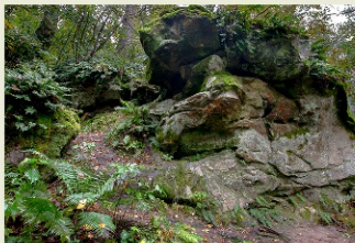
Пещера в скальном обрыве