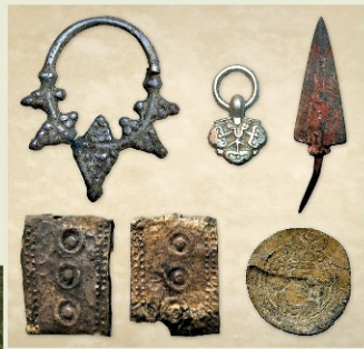
Украшения, наконечник стрелы, детали глиняного набора IX–X вв., восточная монета — драхма VI–VII вв.

Многочисленные вещевые находки составляют весьма специфический набор, складывающийся преимущественно из фрагментов бытовой глиняной посуды, деталей одежды и украшений, предметов вооружения. Но в нем практически отсутствуют какие-либо другие предметы домашней утвари, ремесленный инструментарий и орудия труда. В силу этого городище вызывает много вопросов у археологов. От аналогичных памятников его отличает, кроме того, отсутствие следов жилых, хозяйственных и производственных построек, оград. Эти особенности в конечном счете позволяют сделать предположение о культовом характере объекта.