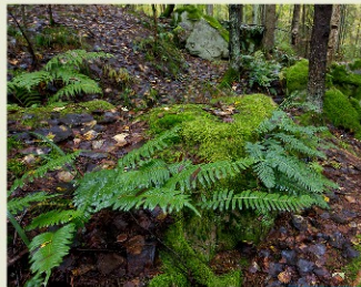
Папоротник многожизненный обыкновенный

«Чертовое городище» — место обитания бабочек: аполлона обыкновенного ( Parnassius apollo ) и мнемозины ( Parnassius mnemosyne ), включенных в Красную книгу РФ. Здесь впервые в области, в р. Чертовой обнаружен новый вид ручейников неурония ( Neuronia ruficrus ). Из крупных зверей изредка отмечаются следы лоса, кабана, косули, волка. На небольшой площади здесь постоянно обитают только не крупные животные, такие как лиса, лесная куница, лесной хорь, горностай, ласка, заяц-беляк, белка.